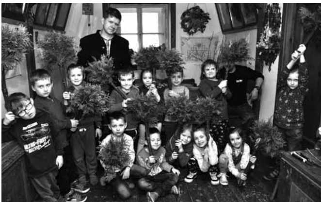
Wspólne zdjęcie z wykonanymi palmami