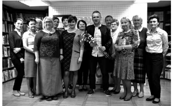
Uczestnicy czytelniczego spotkania

Poza wspomnianym kilkutomowym „Księstwem” znanymi pozycjami w dorobku Masternaka są „Nędzole” (o środowisku polskich emigrantów we Francji), antologia „Co piłka robi z człowiekiem? Młodość, futbol i literatura” (współautor), „Kino polskie 1989 – 2009. Historia krytyczna” (współautor), scenariusze filmowe. W 2009 r. ukończył scenopisarstwo w Krakowskiej Szkole Filmu i Komunikacji Audiowizualnej, zaś dwa lata wcześniej przebywał na stypendium literackim Homines Urbani w Krakowie. W r. 2011 otrzymał Świętokrzyską Nagrodę Kultury.