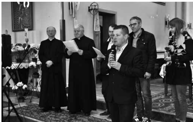
Podziękowanie ze strony wójta i Jury