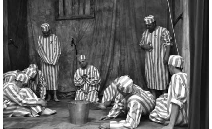
Scena z przedstawienia