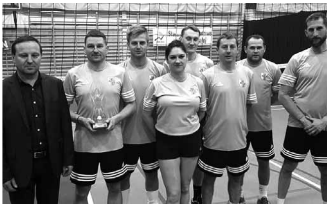
Reprezentacja samorządu gminy Bestwina