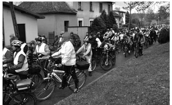
Rajdowy peleton w Bestwinie

Rowerzyści nie nudzili się – muzyczną niespodzianką sprawiła Orkiestra Dęta Gminy Bestwina z siedzibą w Kaniowie. Wójt