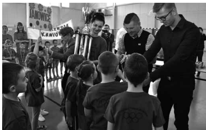
W zawodach zwyciężyło przedszkole z Janowic