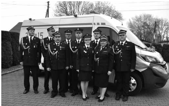
Zarząd OSP Bestwinka przy nowym samochodzie