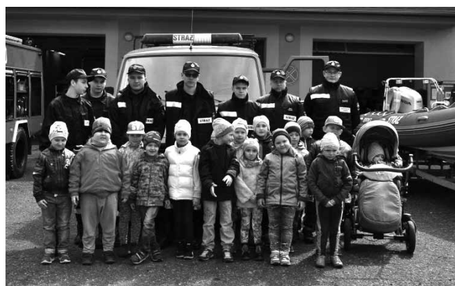
Strażacy z Kaniowa i ich mali goście