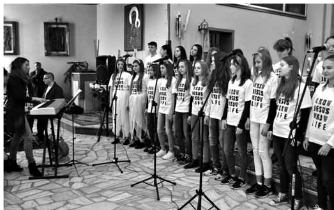
Wysoki poziom zaprezentowały zwłaszcza zespoły z gminy Bestwina

1. „Cantata” z Bestwiny 2. „De – Mollki” z ZSP 1 w Czechowicach – Dziedzicach 3. Chór ZSP Janowice