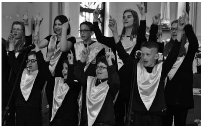
Ciekawe stroje to wyróżniająca się cecha zespołów gospel