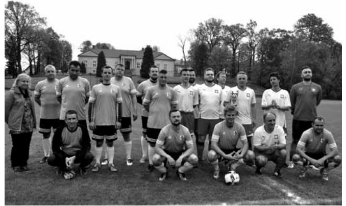
Pamiątkowe zdjęcie obu drużyn